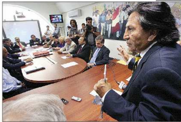
JUNTOS. Al presentar a sus colaboradores, Toledo destacó en ellos su solvencia moral y lo que hicieron por el país.

Toledo aseguró que su equipo no solo conoce cuando las "papas quemán", sino que entre el 2001 y el 2006 fueron quienes concreta-