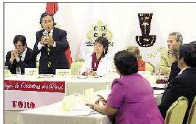
PROMESA. Ofreció captar a los mejores profesionales para su gobierno.

4 Al mediodía, el ex presidente sostuvo un encuentro con los integrantes del Consejo de Decanos de los Colegios Profesionales del Perú. Más tarde, consultado por el debate que se iba a realizar este domingo, Toledo rechazó que la postergación del debate se deba a que haya coincidido con la víspera de su cumpleaños.